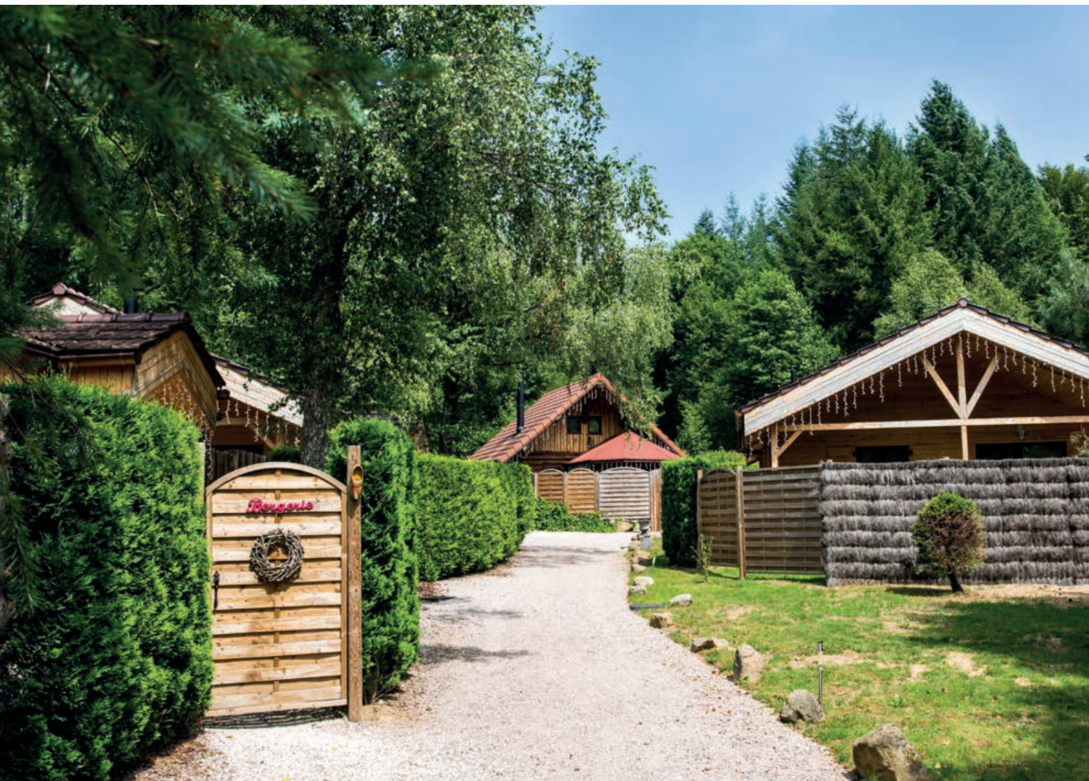
Table gourmande, Hôtel, Chalets et Spa privés